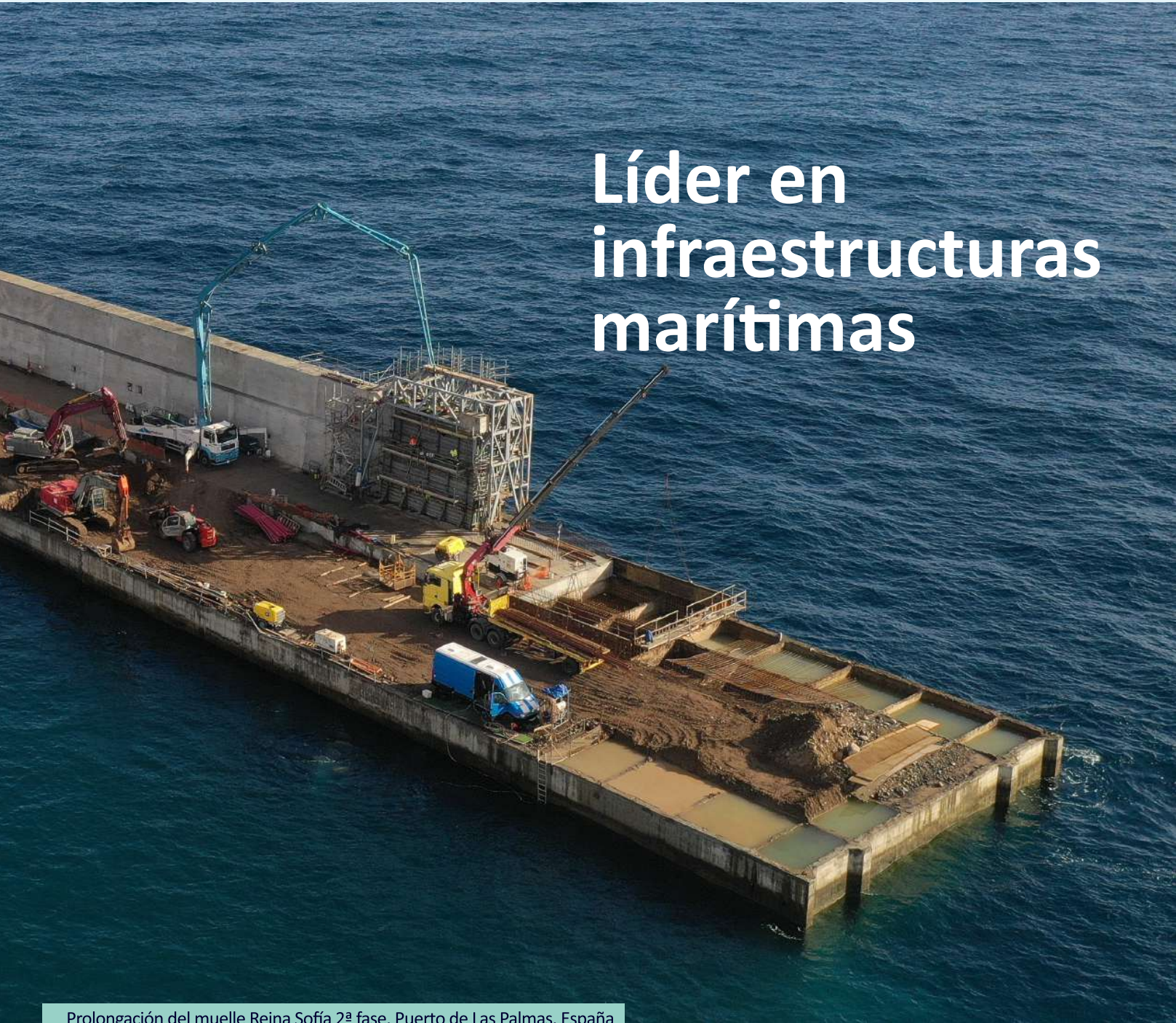
Prolongación del muelle Reina Sofía 2ª fase. Puerto de Las Palmas. España