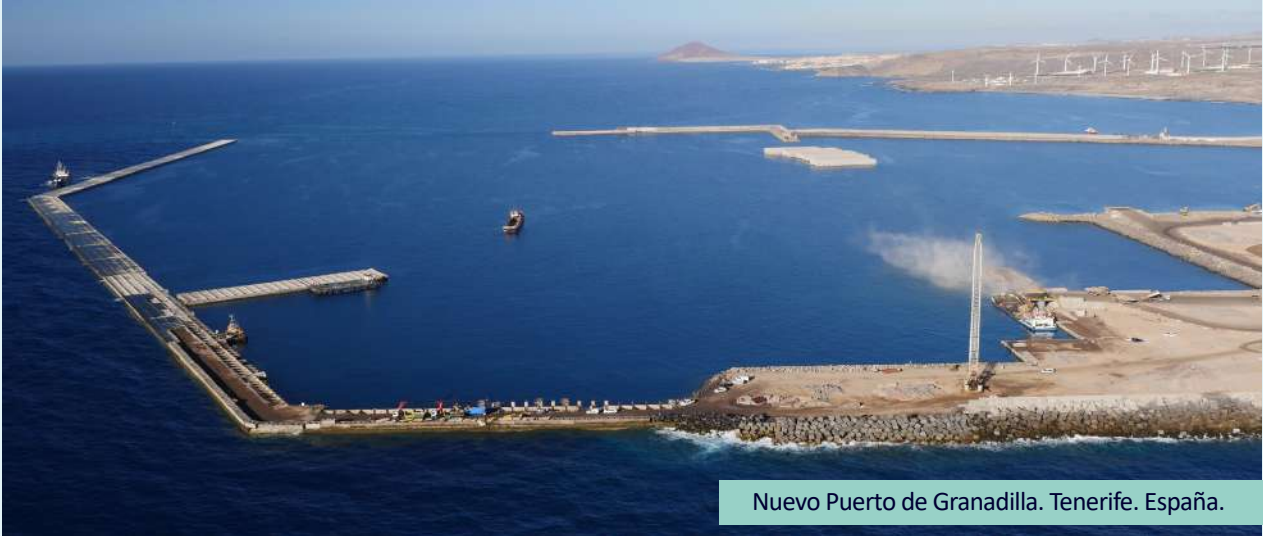
Nuevo Puerto de Granadilla. Tenerife. España.