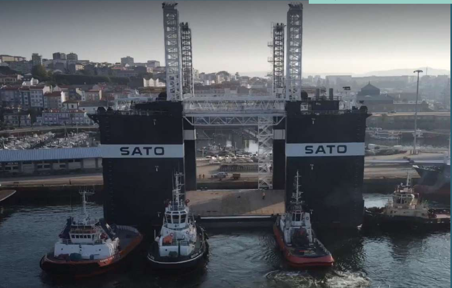
Dique flotante SATO Levante.

Destacan los equipos de fabricación de cajones, como el dique flotante SATO Levante y la pontona SATO Asturias. Ambos aúnan última tecnología y versatilidad, lo que les permite adaptarse a un amplio rango de dimensiones y características.