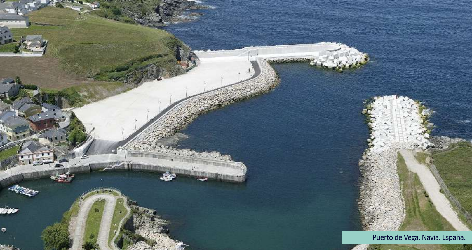
Puerto de Vega. Navia. España.

SATO, filial del Grupo OHLA, es una empresa constructora con casi 100 años de experiencia y una vocación y especialización marítimas desde sus orígenes