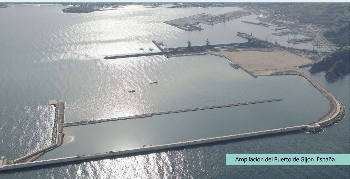
Ampliación del Puerto de Gijón. España.

Desde su fundación, Sociedad Anónima Trabajos y Obras ha desarrollado su actividad en el ámbito portuario y costero