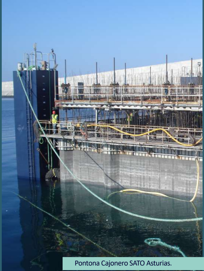
Pontona Cajonero SATO Asturias.