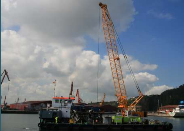
Pontona SATO Algeciras.