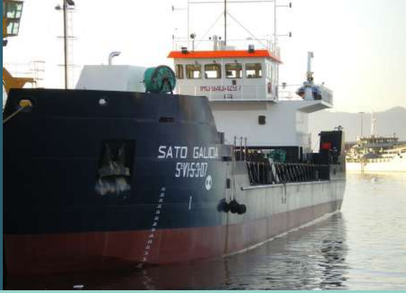
Gánguil SATO Galicia.